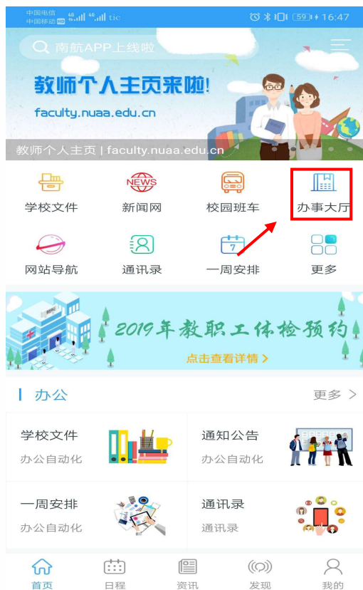
(“i 南航” APP)